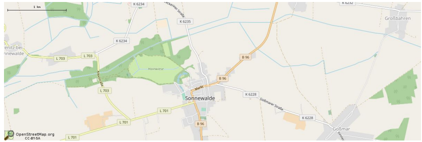
Kartenmaterial von OpenStreetMap - Veröffentlicht unter ODbL .

Sonnenwalde wurde 1255 erstmals in einer Verkaufsurkunde zwischen Johannes von Sunnenwalde und dem Kloster Dobrilugk erwähnt. Die Stadt dürfte jedoch als wendische Sumpfburg,