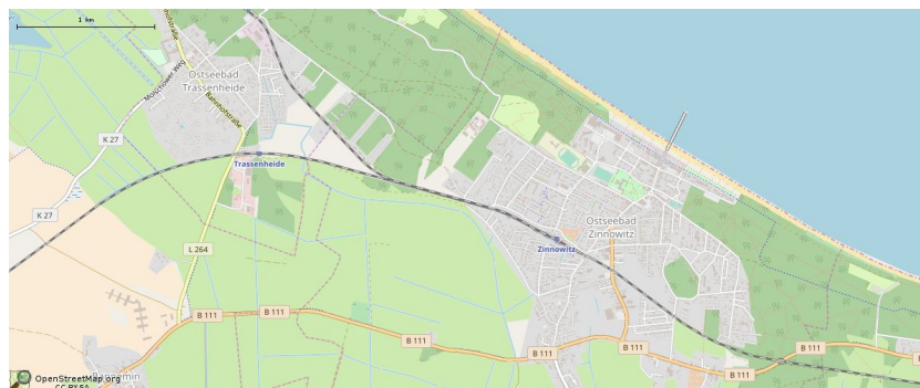
Kartenmaterial von OpenStreetMap - Veröffentlicht unter ODbL .

Zinnowitz ist das größte und traditionsreichste Ostseebad im nordwestlichen Teil der Insel Usedom und liegt auf einer Landenge zwischen der offenen Ostsee und dem Achterwasser.